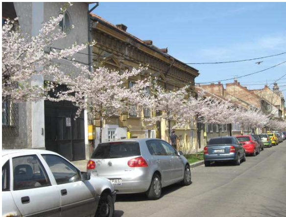
Str. Ion Ghica – Prunus „Accolade”

Timișoara se caracterizează printr-o diversitate redusă a condițiilor fizico-geografice, însă climatul edificat pe un fond temperat continental având influențe submediteraneene este propice pentru dezvoltarea unor plante deosebite, caracteristice acestor zone. Astfel, specii de arbori și arbuști considerate exotice, pot fi acum admirate atât de-a lungul străzilor Timișoarei, cât și în cele mai cunoscute parcuri ale orașului. Putem aminti câteva specii deosebite plantate în urmă cu 2-3 ani, care în prezent oferă un decor deosebit prin portul pendul al coroanei, delicatețea florilor sau culoarea frunzișului și a florilor. Spre exemplu, pe Str. Ion Ghica poate fi admirat în această primăvară Prunus „Accolade”, pe Str. Gheorghe Doja – Malus floribunda, pe Str. Romulus – Prunus subhirtella „Pendula”. De asemenea, Parcul Alpinet a fost îmbogățit cu numeroase exemplare de magnolia din soiuri diferite, care încântă privirea celor ce vizitează acest parc.