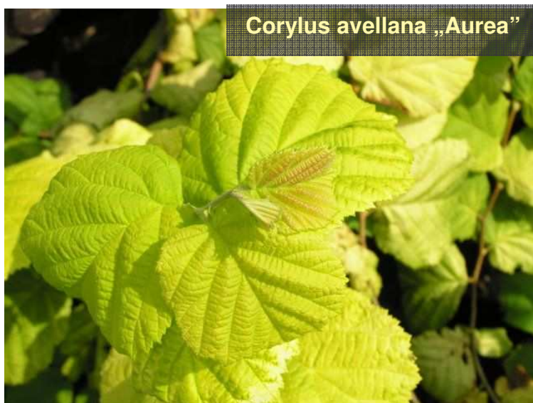
Corylus avellana „Aurea”

Corylus avellana „Aurea” – lăstarii de nuanță portocalie iarna; frunzele galbene-aurii, mai târziu verzi-gălbui.