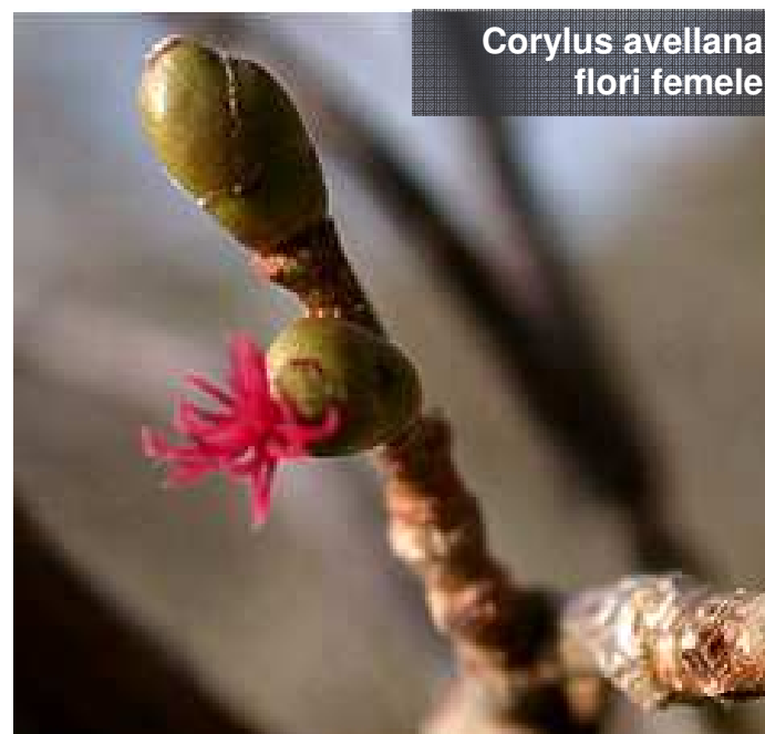
Corylus avellana flori femele