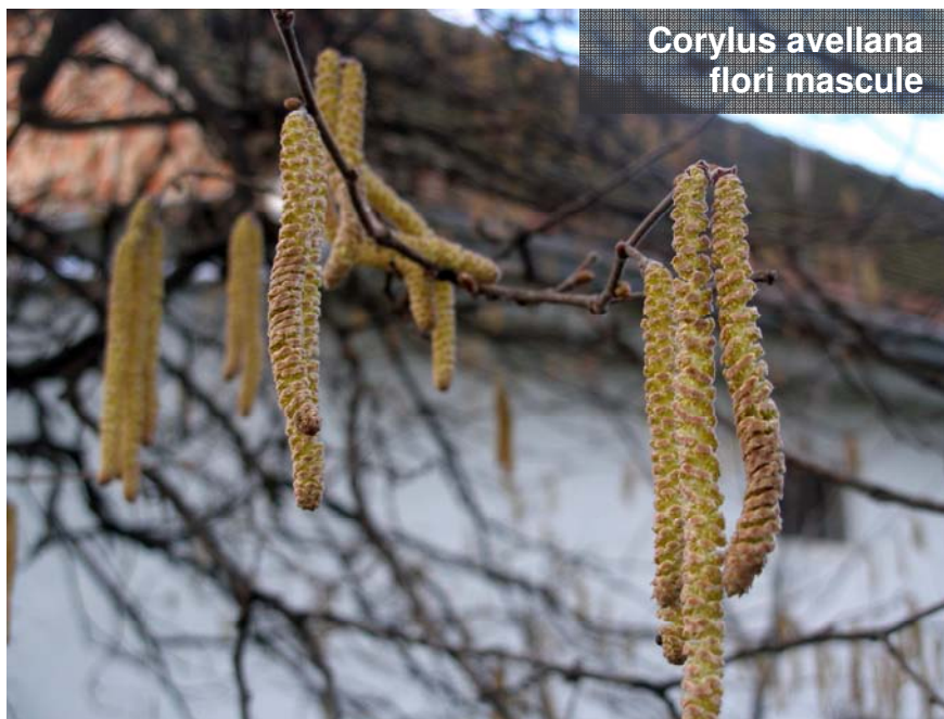
Corylus avellana flori masculine

Genul Corylus are florile masculine dispuse în amenți, iar cele femele în muguri terminali.