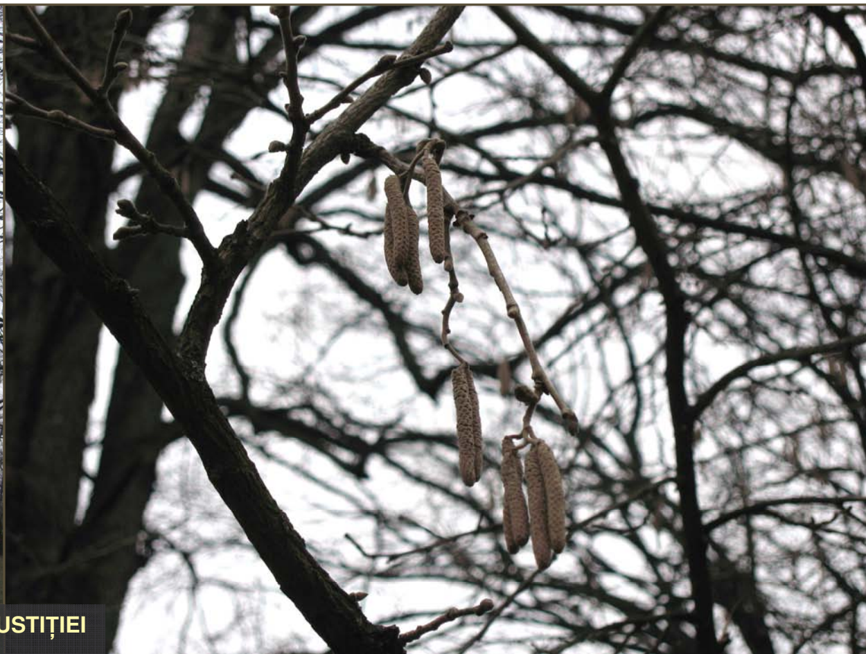
Corylus columna (alunul turcesc) – PARCUL JUSTIȚIEI