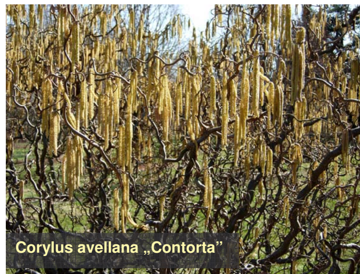
Corylus avellana „Contorta”

Corylus avellana „Contorta” – cu formă de mare efect, având ramurile și lăstarii contorsionați.